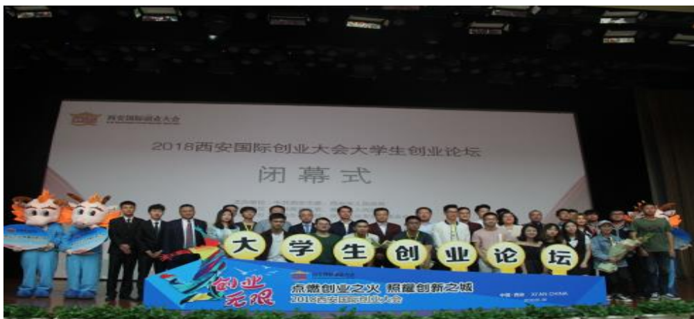
图：参加闭幕式的领导、嘉宾与大学生创新创业团队合影

“创新创业项目路演及投资对接”活动中，来自省内知名高校的八个优秀项目精彩亮相。西北大学、西北政法大学、西安邮电大学、西安科技大学、西安外事学院、陕西交通职业技术学院、西安理工大学带来的工业智能云仓库、多功能家居机器人、多功能水下生物驱离器、互联网 S-FPR 远程智能控制喷漆机等项目，都具有一定创新特质和科技含量，赢得投资专家、创业导师的中肯点评。