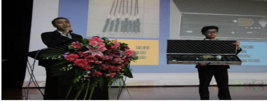
图：西安外事学院的多功能水下生物驱离器参加创新创业项目路演

“创新创业项目路演及投资对接”活动中，来自省内知名高校的八个优秀项目精彩亮相。西北大学、西北政法大学、西安邮电大学、西安科技大学、西安外事学院、陕西交通职业技术学院、西安理工大学带来的工业智能云仓库、多功能家居机器人、多功能水下生物驱离器、互联网 S-FPR 远程智能控制喷漆机等项目，都具有一定创新特质和科技含量，赢得投资专家、创业导师的中肯点评。