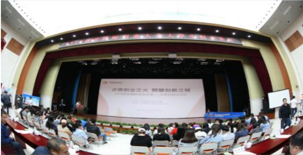
图：西安国际创业大会·大学生创业论坛在外事学院举办

开幕式上，西安市副市长杨广亭，雁塔区委副书记、代区长赵雷等市区领导出席活动并作重要讲话，科技部火炬中心孵化器管理处副处长孙启新等科技部、科技厅领导出席活动，西安外事学院董事长黄藤作为协办单位领导致辞，西安外事学院党委书记孙黎明主持仪式。