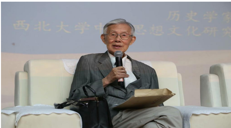
图：张岂之发表主旨演讲

为凝聚一流研究队伍，西安外事学院还特聘张岂之为《原点》杂志编委会名誉主任，特聘肖云儒等专家学者为“人学研究中心”研究员、《原点》杂志编委会委员。西安外事学院“人学研究中心”，主要研究人与人、物、文化、艺术、科学等之间的关系及其在教育中的应用，并出版专业性研究期刊《原点》。